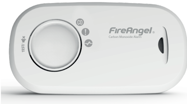
let op: logo en markeringen kunnen per EU land verschillen