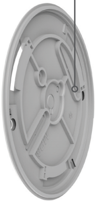
Verzegelde lithiumbatterij met een levensduur van 10 jaar