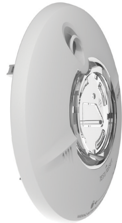
Grote sensorkamer die de stabiliteit en de nauwkeurigheid van de melder verbeteren