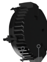
Geavanceerde optische sensoren om ongewenste meldingen te vermijden